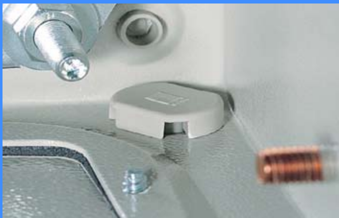
Покрив при монтаж на открито