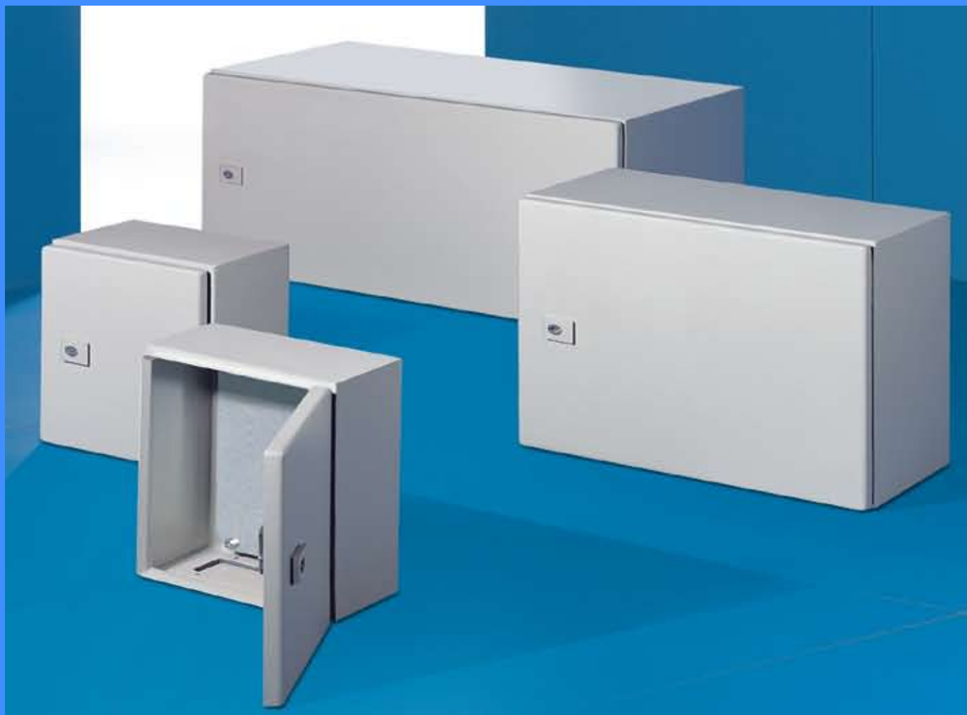
ТАБЛА АЕ С МОНТАЖНА ПЛОЧА