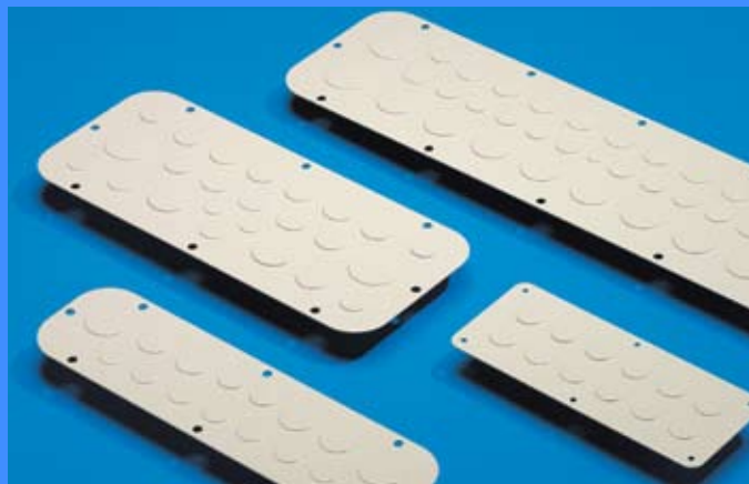
Метални и пластмасови щущери

Метални и пластмасови подови плочи с подготвени отвори за различни размери щущери