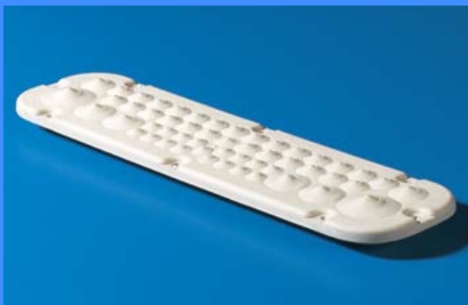
Изпускателен клапан за конденз